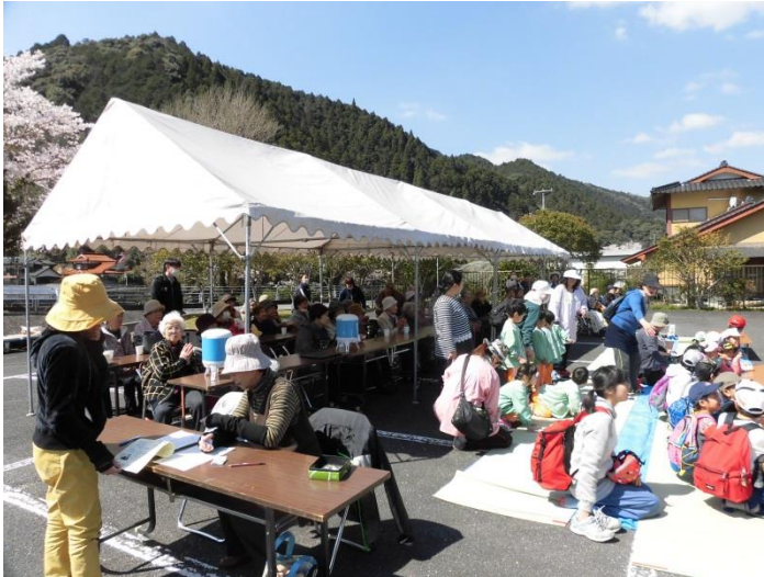
さくらまつりへの外出！

かわかみ苑のユニットでは、毎月、外出行事を実施しており、気分転換や地域との交流を進めています。また、体調等により外出行事への参加ができなかった場合には、個別の外出も実施しています。